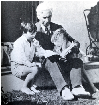
เบอร์ทรันด์ รัสเซลล์ (Bertrand Russell)

รายงานฉบับนี้จัดทำขึ้นโดยข้อมูลเท่าที่ปรากฏและเชื่อว่าเป็นที่น่าเชื่อถือได้แต่ไม่ถือเป็นการยืนยันความถูกต้องและความสมบูรณ์ของข้อมูลนี้ๆ โดยบริษัทหลักทรัพย์ ยูเอสบี เคย์ ฮีเยน (ประเทศไทย) จำกัด (มหาชน) ผู้จัดทำ ขอสงวนสิทธิ์ในการเปลี่ยนแปลงความเห็นหรือประกาศการณ์ต่างๆที่ปรากฏในรายงานฉบับนี้ โดยไม่ต้องแจ้งล่วงหน้า รายงานฉบับนี้มีวัตถุประสงค์เพื่อประกอบการตัดสินใจของนักลงทุน โดยไม่ได้เป็นการชี้แนะให้ท่านให้นักลงทุนทำการซื้อหรือขายหลักทรัพย์ หรือตราสารทางการเงินใดๆ ที่ปรากฏในรายงาน